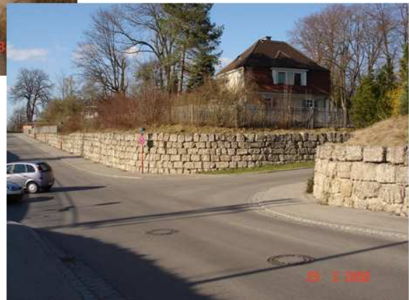
Deisenhofen, Gartenstraße Unterführung Ostseite