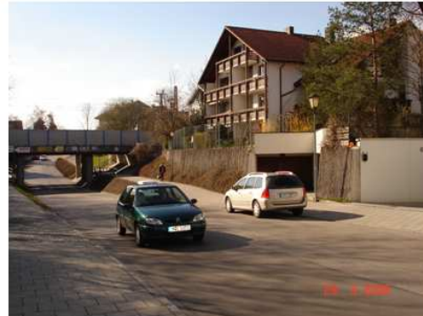
Bilder oben: Einfahrt von Osten