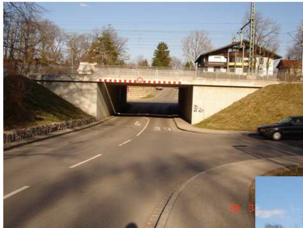
Deisenhofen, Gartenstraße Unterführung Westseite