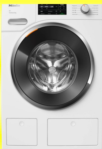
Miele WWG760 WPS TDos&9kg mit Warmwasseranschluss